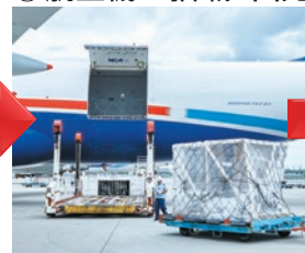
⑨ 航空機へ搭載・出発