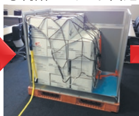
③ 荷詰め・ネット固定