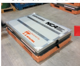
① 完全折り畳み状態