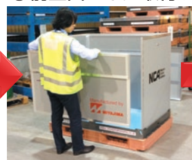
④ 前壁面パネル取付け