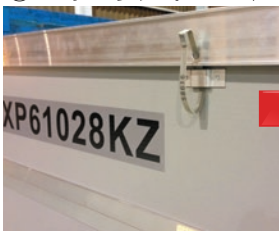
⑥ セキュリティ・シール