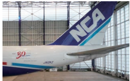
2015年5月、 運航開始30周年を記念してボディペイントを実施