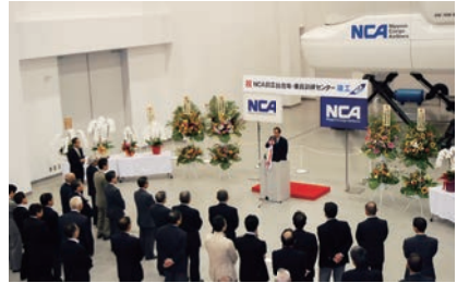
2008年5月、 創立30周年にあわせて成田乗員訓練センターが竣工