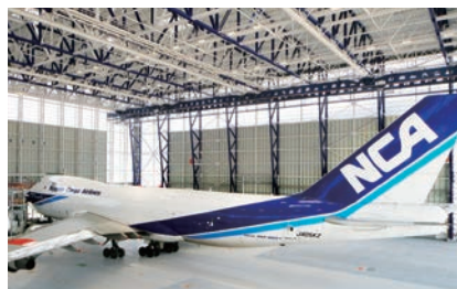
自然光によって明るい格納庫内