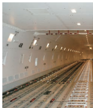
メインデッキ内部