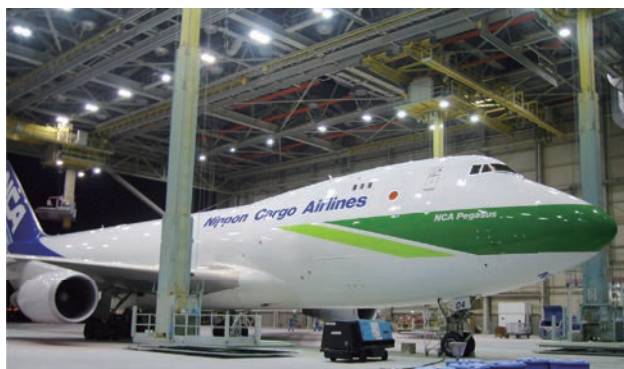
環境負荷の低いペイントシステムを導入した「NCAグリーンフレイター」(2009年5月運航開始)