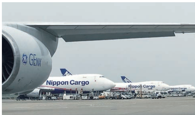
B747-8FにはGEenx-2Bエンジンを装備した