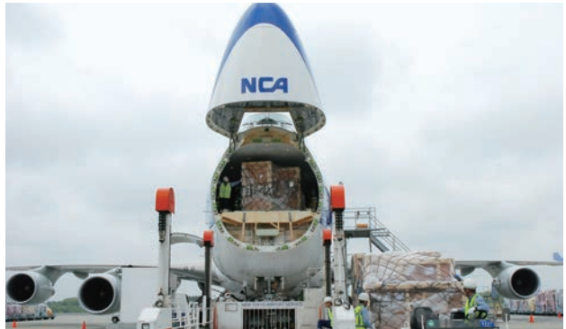
ノーズカーゴドアを開けた状態