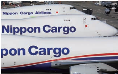
B747-8FとB747-400F(奥の1機)の駐機 (2014年撮影)