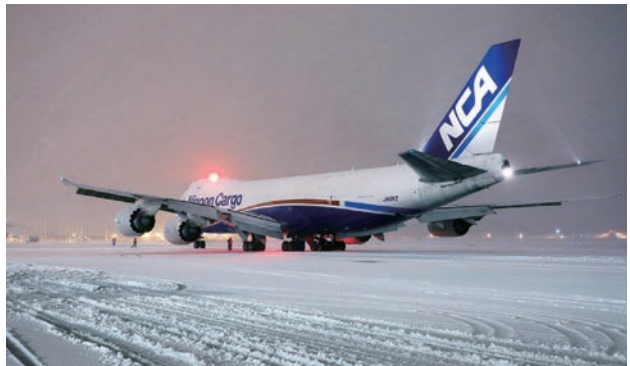
雪上をタキシングするB747-8F