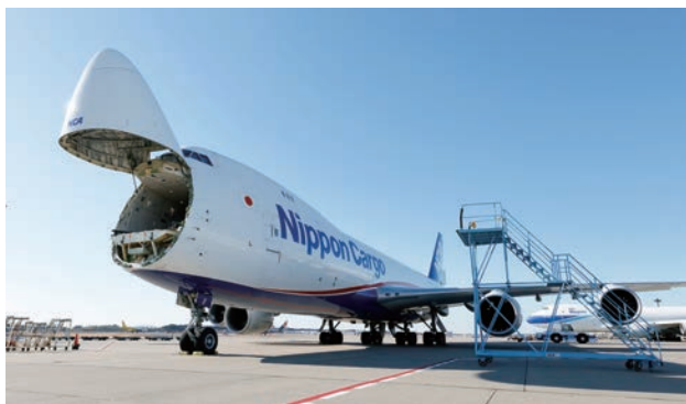
ノーズカーゴドアを開けた状態