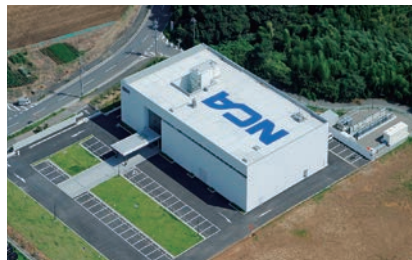
上空から見た訓練センター