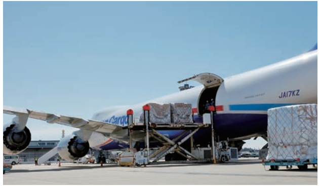
サイドカーゴドアからの搭降載