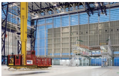
ノーズスタンドとゴンドラクレーン