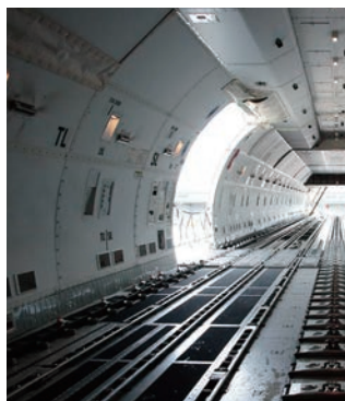
メインデッキ内部