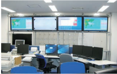
2008年3月、 グローバルオペレーションセンター(GOC)開設