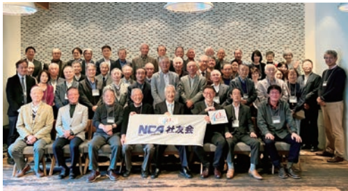
2015年9月「OB/OG会」発足。 2023年に「社友会」へ名称変更 (2025年11月撮影)