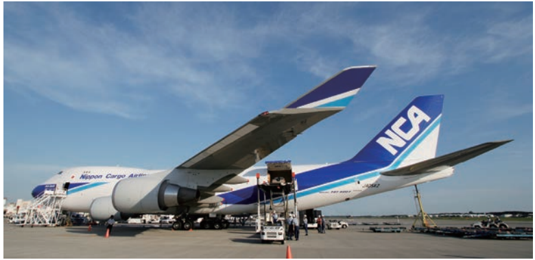
サイドカーゴドアからメインデッキローダーによる搭降載