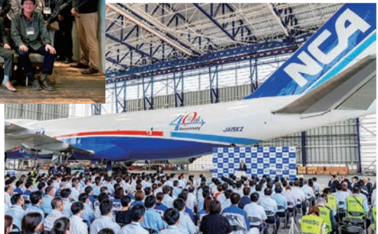
2025年8月、成田でNCAのANAグループ歓迎式典開催