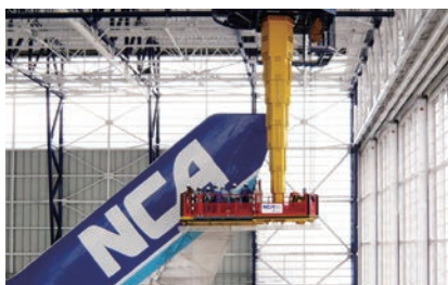
ゴンドラクレーン