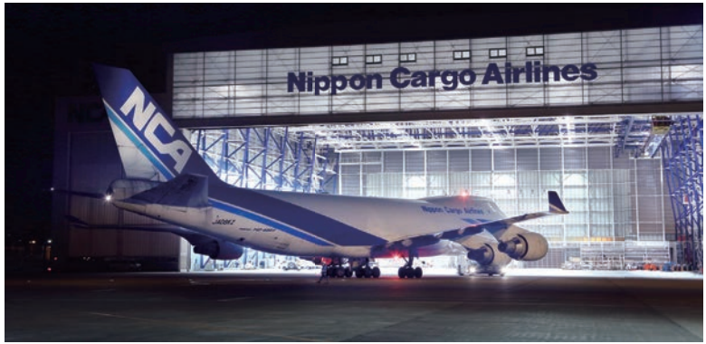
ハンガーに入庫するB747-400F